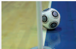
But non marqué