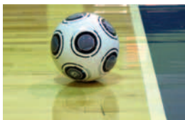
Ballon hors du jeu