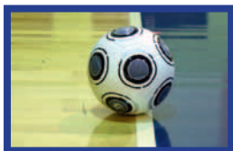
Ballon en jeu

Lorsque le ballon touche le plafond, le jeu reprend par une rentrée de touche accordée à l'équipe adverse du joueur ayant touché le ballon en dernier. La rentrée de touche est effectuée du point situé sur la ligne de touche le plus proche de l'endroit au-dessus duquel le ballon a touché le plafond.