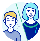
ÉVITEZ LES CONTACTS AVEC LES PERSONNES INFECTÉES