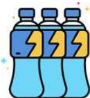
MINIMISEZ LE PARTAGE DE MATÉRIEL (COMME LES BOUTEILLES)