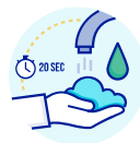
LAVEZ-VOUS LES MAINS RÉGULIÈREMENT