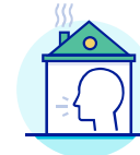
ISOLEZ-VOUS EN CAS D'APPARITION DE SYMPTÔMES

En cas de doute sur des symptômes de la COVID-19, demeurez à la maison.